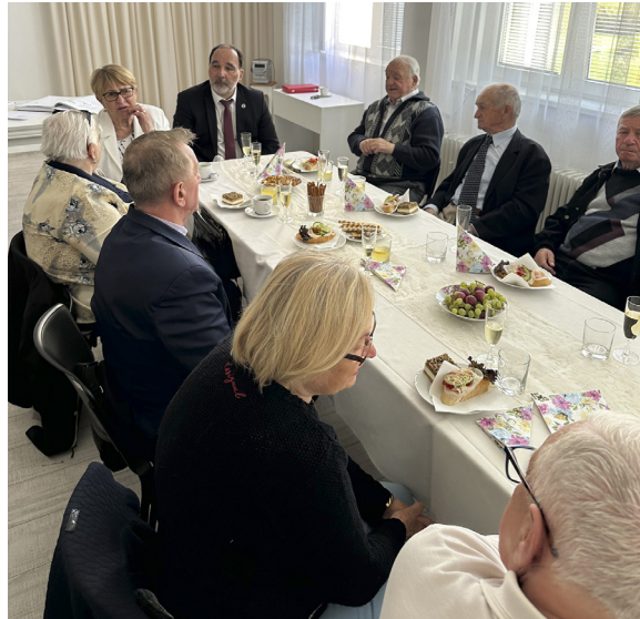
slávnostnom príhovore sa jubilanti zapísali do pamätnej knihy mesta. Spoločné stretnutie sa nieslo v

Podujatie pokračovalo stretnutím s oslávencami. Životné jubileum v uplynulom štvrtroku oslávilo 57 obyvateľov Ilavy vo veku 70, 75, 80, 85, 90 a 95 rokov. Po