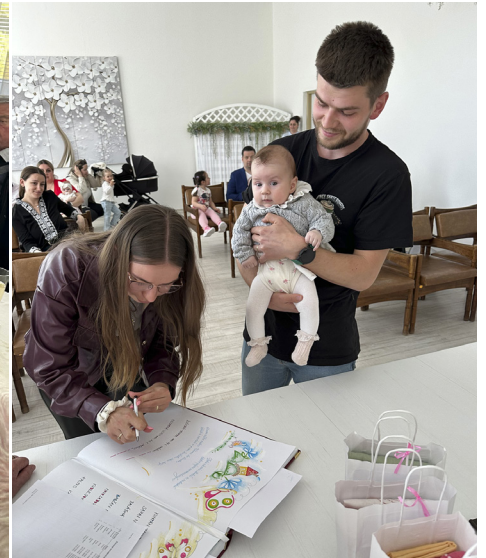
príjemnej atmosfére a po oficiálnej časti pokračovalo posedením s občerstvením, ktoré poskytlo