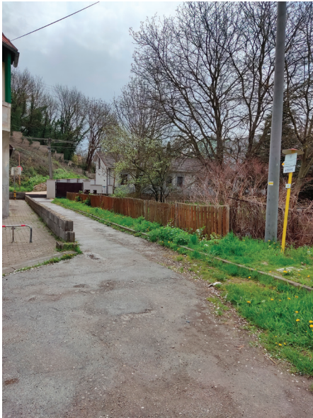
V pláne je dokončenie chodníka z námestia na parkovisku pri želez. stanici.