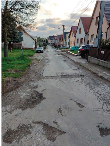
Záhumenská ulica si nepochybne zaslúži obnovu. Dôjde aj k jej zjednosmerneniu.