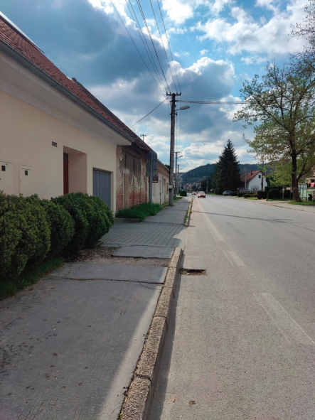
Na rad príde aj chodník na Pivovarskej ulici.