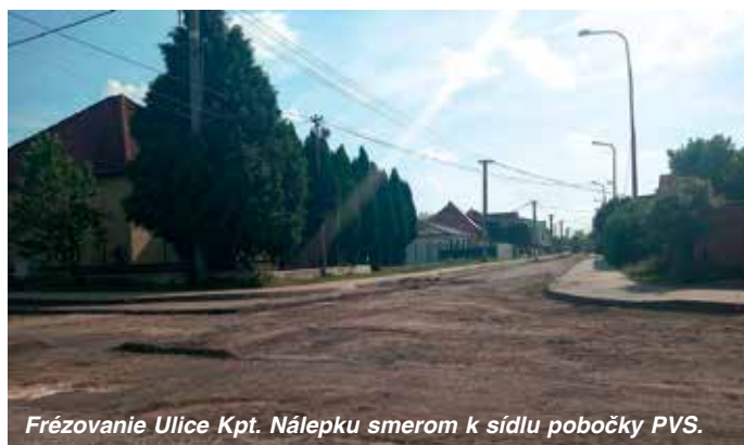
Frézovanie Ulice Kpt. Nálepku smerom k sídlu pobočky PVS.

Rekonštrukcia začne na križovatke ulíc Medňanská, Hollého a Jesenského, ďalej bude pokračovať pred bytovými domami č. 518 a 515. Pred bytovým domom č. 518 sa komunikácia rozšíri a vybudujú sa tu parkovacie miesta – po pravej strane pozdĺžne, po ľavej strane kolmé. Zároveň sa priestorovo posunú jestvujúce chodníky a naopak tie chýbajúce popri križovatke sa doplnia. „Plocha medzi bytovými domami, na ktorej sú umiestnené nádoby na odpad a využíva sa aj pre neorganizované parkovanie, sa stavebne upraví tak, aby bola 3,5 m od objektov a bude slúžiť len na umiestnenie nádob na odpad.“