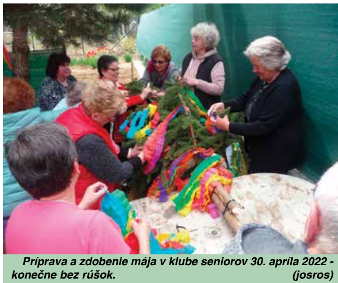
Príprava a zdobenie mája v klube seniorov 30. apríla 2022 - konečne bez rúšok. (josros)