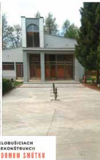
CINTORÍN V KLOBUŠICIACH - PRED A PO REKONŠTRUKCIÍ CHODNÍK PRED DOMOM SMÚTKU