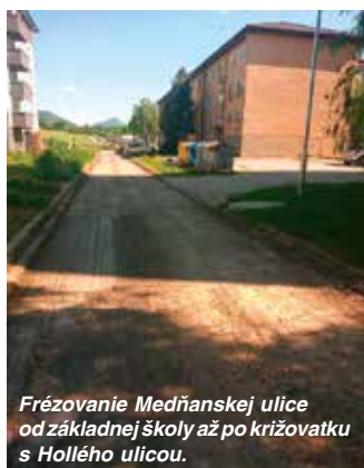
Frézovanie Medňanskej ulice od základnej školy až po križovatku s Hollého ulicou.

V tretej etape rekonštrukcie ciest a chodníkov sa kompletne zrekonštruovala prvá jednosmerka tejto ulice na sídlisku Sihof s prepojením na Mlá-