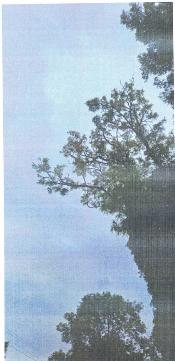
Zámocká ulica – previsajúci strom