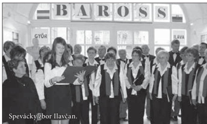
Spevácky zbor Ilavčan.