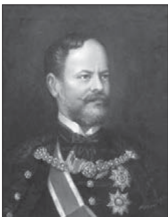
Portrét G. Barossa, olejomalba, výtvarníčka A. Teicherová

Slávnostný koncert a výstava v partnerskom meste Győr.