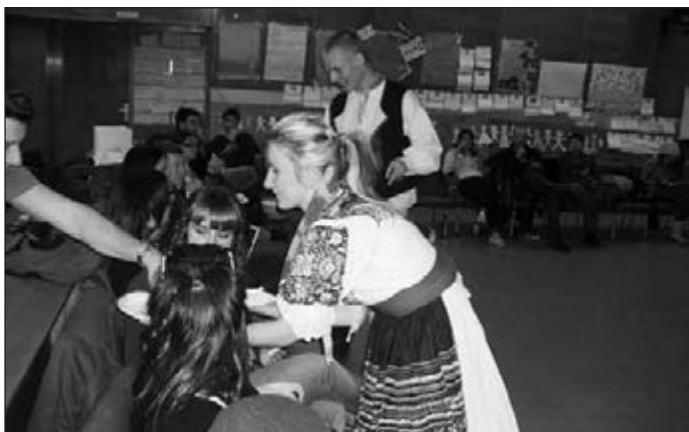
Slovenské syry chutili

Zistili sme, že národné piesne, tance, jedlá, tradície a remeslá sú tým, čo treba od starších prevziať ako štafetu pre ďalšie generácie. Naopak mladí pomáhajú starším lepšie zvládať moderné technológie a výdobytky techniky. Potrebujeme sa navzájom.