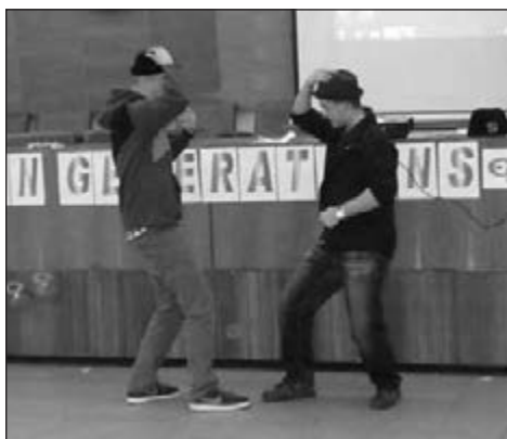
Pokus o ukážku klobúkového tanca

Ďakujeme folklórnemu súboru Mladosť z Dubnice nad Váhom za zapožičanie krojov pre tento projekt.